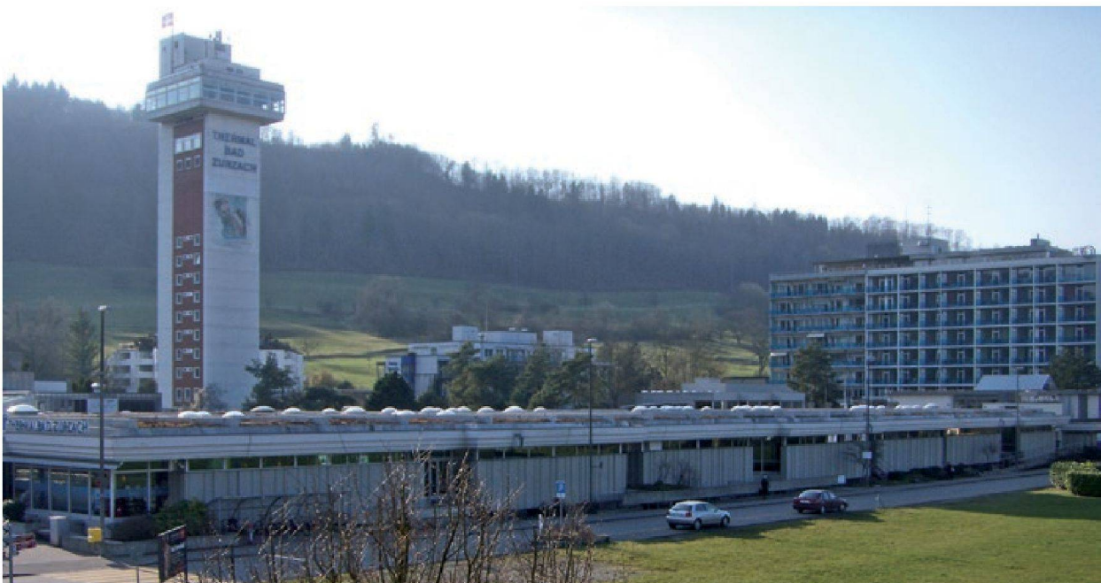
Abb. 9: Ansicht Bad Zurzach, Thermalbad. Der 1963 erbaute Turm ermöglicht die Druckregulierung des ausfliessenden Thermalwassers