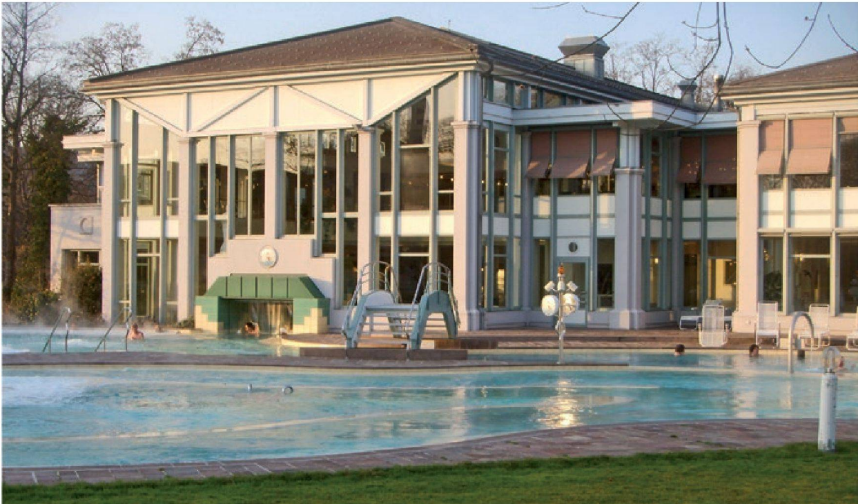
Abb.8: Bad Schinznach, Aussenbad mit „Aquarena“