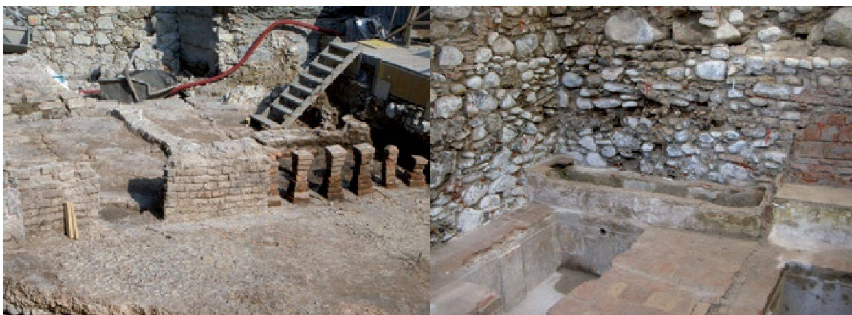
Abb. 2: Aktuelle archäologische Grabungen im Bäderquartier von Baden: links auf dem Areal „Stadthof“, rechts auf dem Areal „Hinterhof“