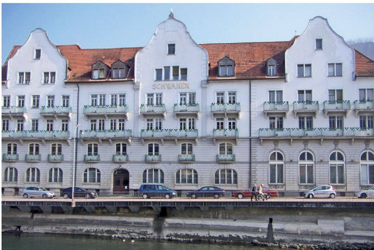
Abb. 3: Jugendstil-Bäderhotel „Schwanen“ in Ennetbaden, welches seit 1976 eine Fremdnutzung aufweist. Der Freispiegel der Schwanen-Quelle reicht bis ins erste Obergeschoss und liegt damit etliche Meter höher als der Limmat-Spiegel. Eine Neunutzung des Thermalwassers ist geplant.