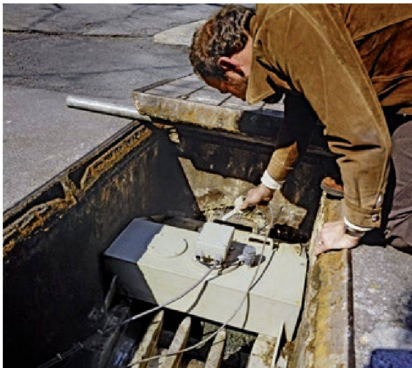
Abb. 6: Probenahme und Kontrollmessungen bei den Thermalquellen in Baden

stoff-14 aus der jungen, kalten Komponente stammt, ist die thermale Komponente bedeutend älter. Basierend auf Isotopenuntersuchungen und hydrochemischen Daten (Abb. 6, 10) ist die thermale Komponente eine Mischung zwischen einem Muschelkalk-Grundwasser und einem sehr alten Anteil aus tieferen Aquiferen (Kristallin, Perm oder Buntsandstein). Das bereits erwähnte kantonale «Grabungsverbot nach Heilwasser» ist auch heute noch bei Bauarbeiten im Bereich der Thermalquellen zu beachten. Dadurch geniessen die Thermalquellen von Baden und Ennetbaden zumindest im näheren Umfeld ihres Austrittes einen gewissen Schutz vor Beeinträchtigungen.