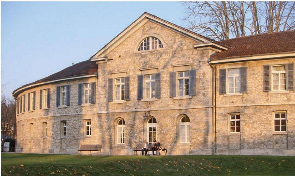
Abb. 7: Heutiges Thermalbad Schinznach für therapeutische Zwecke (historischer Rundbau)

Wasser mit rund 63°C. Weil dieses Wasser jedoch stark salzhaltig und wenig ergiebig war, wurde die Bohrung in 415 m Tiefe abgedichtet und es wird nur das obere Wasser aus dem Muschelkalk-Aquifer genutzt.