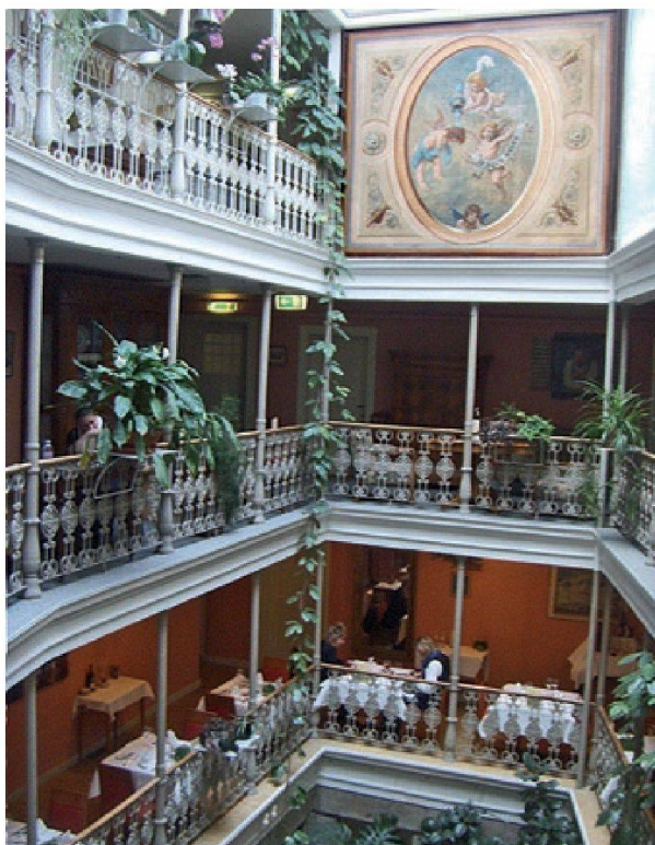
Abb. 5: Detailansicht Bäderhotel „Blume“ in Baden (Innenhof)

Die Gesamtschüttung aller 19 gefassten Quellen schwankt im Bereich zwischen rund 600 und 800 l/min, mit Extremwerten von 569 l/min (1950) und 949 l/min (1970). Die Temperaturen schwanken im Bereich von 46.5–48.5°C. Eine Zusammenstellung der Koten und Schüttmengen der einzelnen Quellen findet sich in Biehler et al., 1993 (S. 43).