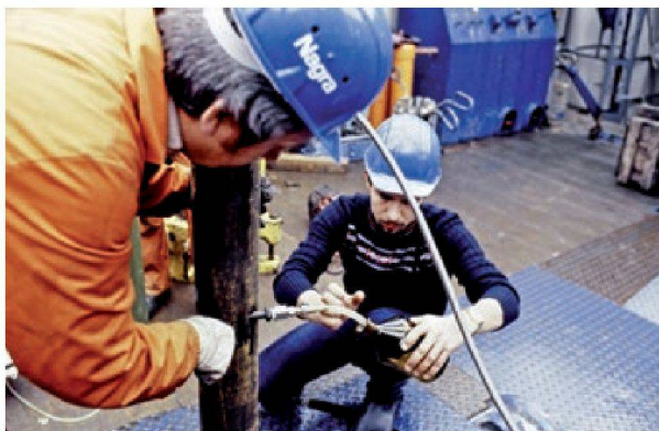
Abb. 11: Probenahme von Thermalwasser aus einer Nagra-Bohrung

subthermal (knapp 20°C). Es wurde eine hohe Mineralisierung festgestellt (Schmassmann et al. 1984). Auf Grund der Zusammensetzung liegt ein Mischwasser aus Kristallin, Perm und Buntsandstein vor. Zur Zeit findet keine Nutzung dieses Wassers statt.